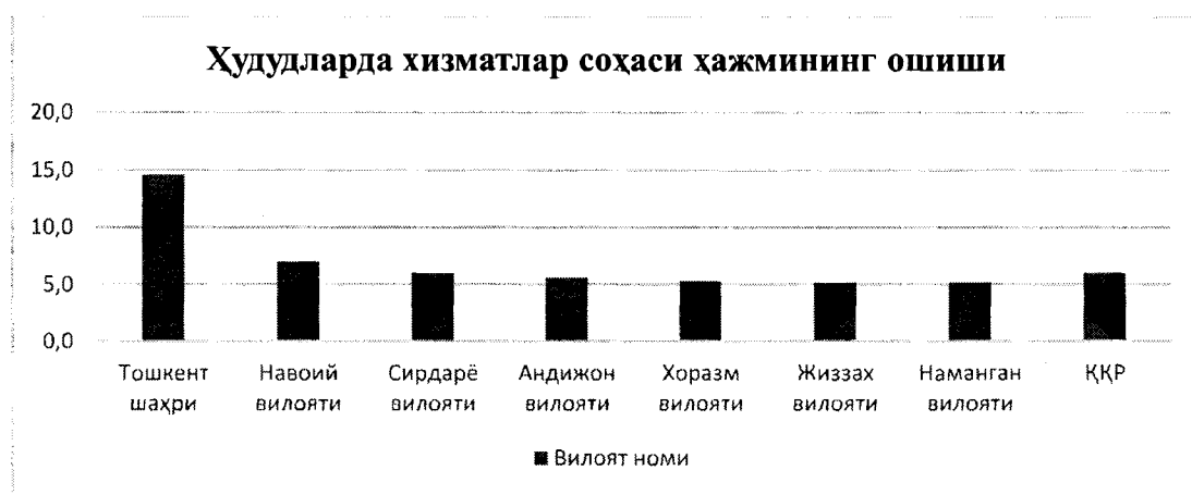
1-расм. Худудларда хизматлар соҳаси ҳажмининг ошиш суръатлари.

Ҳудудлар бўйича таҳлил қиладиган бўлсак, юқори ўсиш суръатлари Тошкент шаҳрида 14,6 фоиз, Навоий 7,0 фоиз, Сирдарё 6,0 фоиз, Андижон 5,6 фоиз, Хоразм 5,3 фоиз, Жиззах 5,2 фоиз, Наманган вилоятларида 5,0 фоиз ҳамда Қорақалпоғистон Республикасида 6,0 фоизга ўсиш кузатилди.